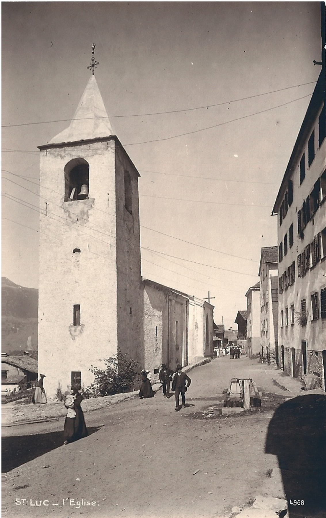
ST. LUC - l'Eglise.