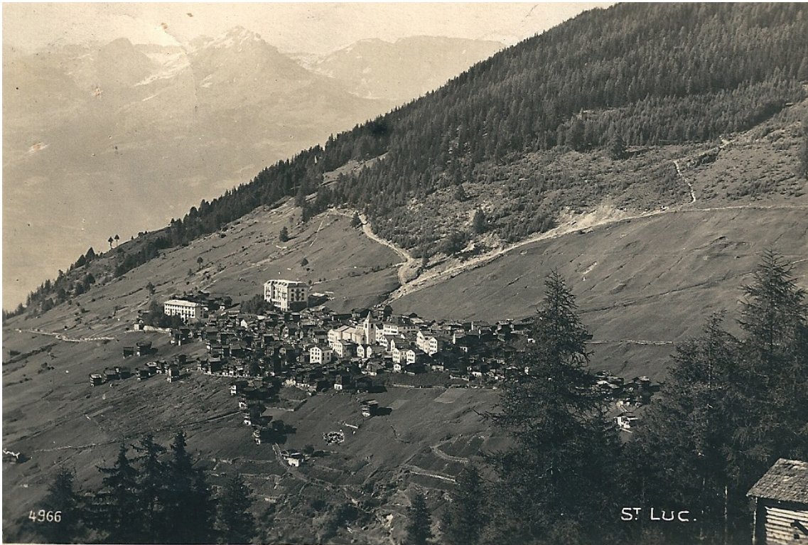
St-Luc vers 1900